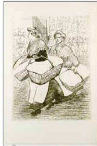
Ets van Théophile Alexandre Steinlen (1859-1923), tekenaar, schilder, graficus. Wasvrouwen in Parijs.

Wassen en kunsthistorische waarde : in zijn algemeenheid kan worden gesteld dat de kunstwaarde, de aanwezigheid van kunst en bijzondere kunst in ons museum op het thema Wassen en Strijken van hoog gehalte is. 'Kunst' in schilderijen, prenten en tekeningen. Met andere woorden, ons museum bestaat niet alleen uit een heel grote collectie handgemaakte strijkbouten (dat zijn er al meer dan 1300 uit alle delen van de wereld), maar ook uit beelden en meubels en werktuigen. Ook is de kunsthistorische waarde van het Brabants erfgoed van ons museum (objecten en archieven) van zeer hoog gehalte.